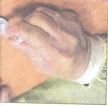
Une fois le prélèvement fait, le pharmacien prépare la solution.