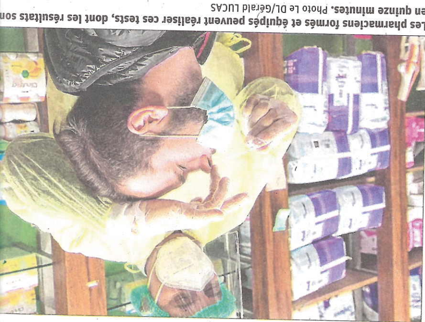
Les pharmaciens formés et équipés peuvent réaliser ces tests, dont les résultats sont en quinze minutes.

Une fois le prélèvement effectué, il est appliqué sur une petite plaquette. Si un seul trait apparaît c'est négatif, deux c'est positif. « Actuellement on teste uniquement entre 17 heures et 19 heures, soit une quinzaine de personnes par jour. Au début du mois de novembre un test sur deux ou trois était positif, actuellement c'est environ un par jour », complète le pharmacien. Chaque résultat, positif ou négatif, est communiqué à la sécurité sociale. Ces tests sont fiables à 98 %.