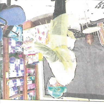
Le prélèvement se fait dans la salle de vaccination soigneusement désinfectée deux prélèvements.